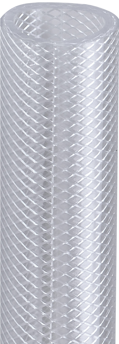
Tubo in PVC-P / PVC-P hose

• Delivery of liquids and food grade substances. It is often used for filling machines and dispensers.