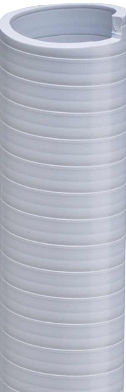
Scheda tecnica / Technical data